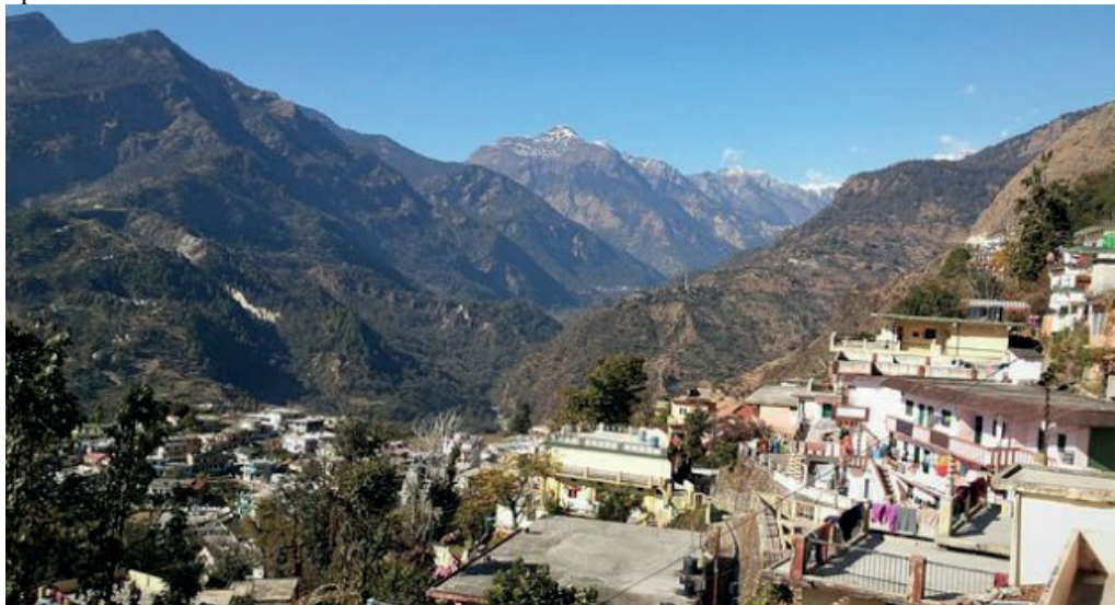
Figura 1: Uma das imagens mais impactantes dos efeitos da pandemia na natureza, o Himalaia visível pela primeira vez após 30 anos

Desde que a Organização Mundial da Saúde (OMS) declarou estado de pandemia para a Covid-19, diversas tentativas de conter a disseminação do vírus foram propostas e implementadas, como, por exemplo, o isolamento social da população. A baixa atividade humana dos últimos meses gerou uma série de consequências e impactos, e, no tangente ao meio ambiente, muitas das mudanças foram positivas, como podemos ver a seguir na figura 1. (Ufjf, 2020).